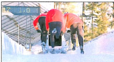
ALLE OMBORD: Å få med alle fire når starten går, er en av de største utfordringene på en firerbob.